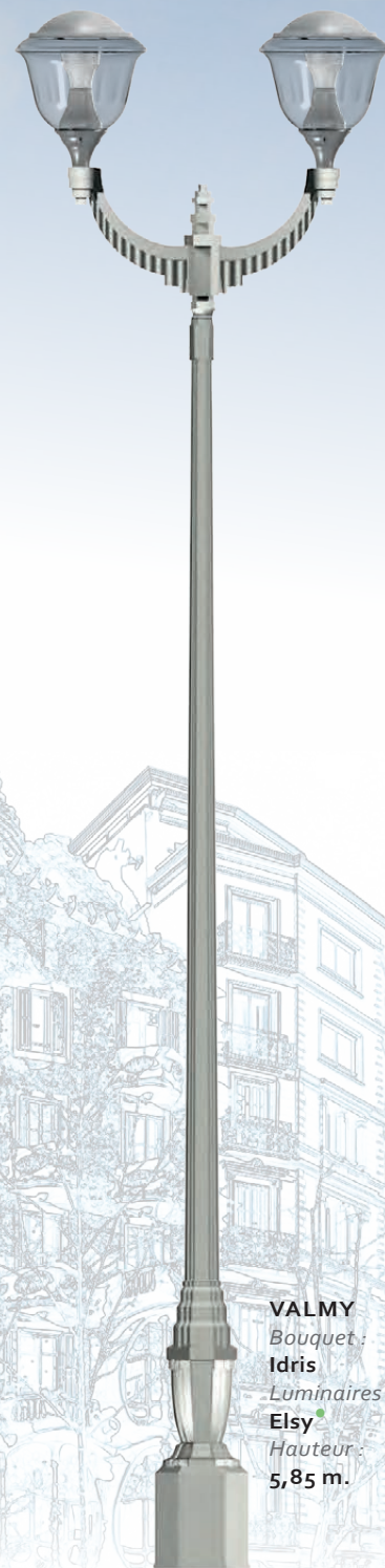
VALMY Bouquet : Idris Luminaire : Elsy Hauteur : 5,85 m.