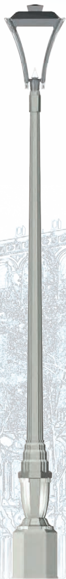
VALMY Luminaire : Stanza Hauteur : 4,22 m.